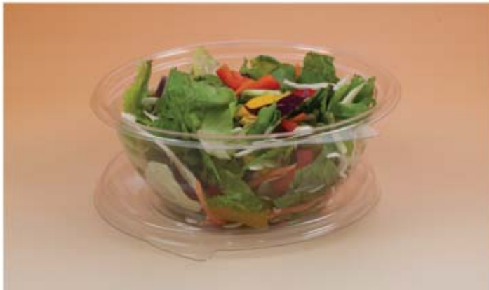
Salatschalen mit anhängenden Deckeln