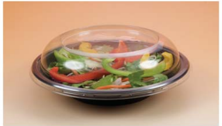
Salatschalen mit separatem Deckel

Die hochwertige Qualität, tolle Optik und Haptik, sowie ein wirtschaftlich durchdachtes Handling zeichnen die auf den folgenden Katalogseiten aufgeführten Artikel aus.